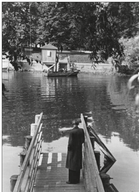
JOONIS 5. Emajõe ületamas, 1956. TMF 1470: 5.