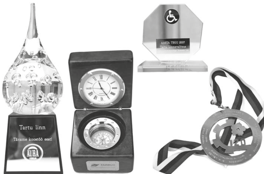
JONNIS 3. Tartu linnavalitsusele aastatel 2004–2013 kingitud esemeid. TM 3474: 10, 15, 16, 23 Aj.