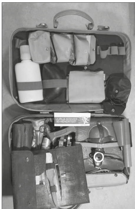
JOONIS 2. Operatiivjälituse toimingute kohver ja selles leiduvad töövahendid.