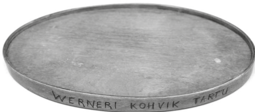
JONNIS 4. Tartus Werneri kohvikus 1920.–1930. aastatel kasutusel olnud kandik.

toodangu vedamiseks. Kastid jõudsid muuseumisse antiigikaupluse OÜ Tehtart vahendusel.