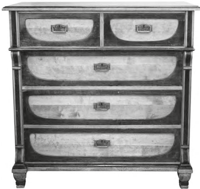
JOONIS 2. Kummut 19. ja 20. sajandi vahetusest. TM 3371.

Kuna museaalide säilitamine nüüdisaegsete nõuete järgi on töömahukas ja kulukas, on muuseum võtnud suuna kogude kvaliteedi parendamisele. See ei tähenda üksnes kriitilist kogumistööd, vaid ka kogutud materjali korrastamist. Nii kulutas linnamuuseum kogudele mõeldud eelarvest ligi poole museaalide konserveerimiseks. Olulise tööna korrastati 19. sajandi Tartu linnakodaniku püsiekspositsioonis eksponeeritav mööbel.