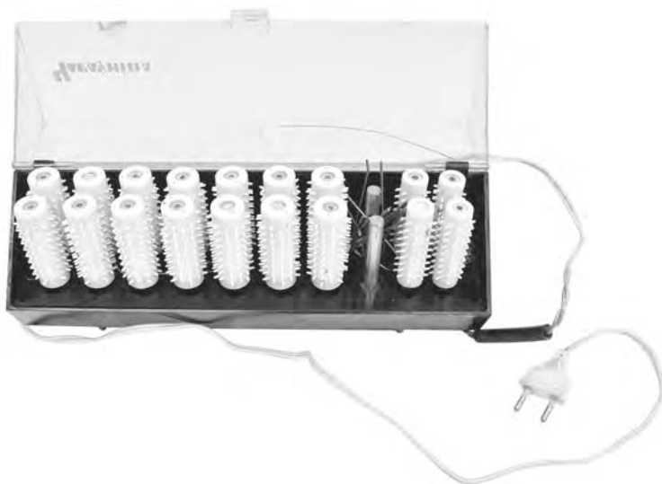
JÕONIS 3. Elektriline lokirullide soojendaja osteti 1970ndate lõpus. TM 3396: 1.

Tartu Linnamuuseumi filiaal Tartu laulupeomuuseum on enda ümber koonandanud sõpruskonna, kelle kaasabil täieneb muuseumikogu laulupeoteemalise materjaliga. Üks suuremaid annetajaid on meeskoor Gaudeamus. 2012. aastal jõudsid muuseumisse koori esinemisriided, kontserdireisidelt saadud suveniirid, fotod kontsertidest ning mitmesugust arhiivimaterjali, samuti 2009. aasta üliõpilaslaulupeo «Gaudeamus» juht ja plakatid.