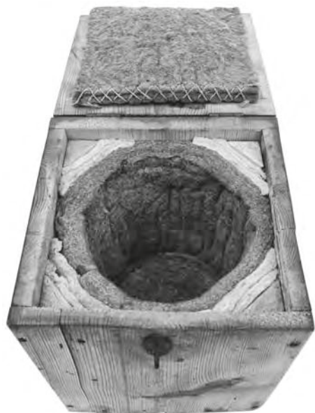
JOONIS 4. 20. sajandi esimesel poolel kasutatud toiduhautamiskast. TM 3418: 1.