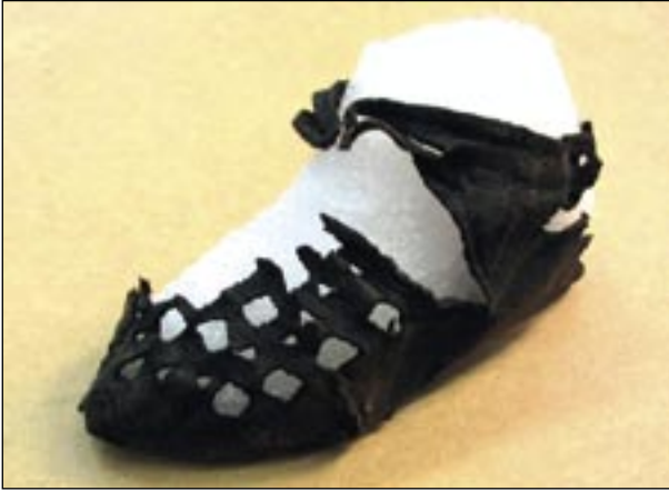
Joonis 4. Väikelapse paelking (TMM 20764: 1782). Pikkus 11 cm. Vanha Suurtori kaevand, Hjelti maja (1989), 13. saj. lõpp.