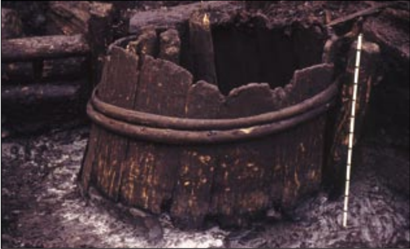
Joonis 2. Tõenäoliselt parkimiseks ja/või tekstiilide värvimiseks kasutatud tõrs (TMM 21816: KP12857). Äbo Akademi krundi kaevand, 14. saj. lõpp/15. saj. algus.

nii parkimisel kui värvide kinnitamisel kasutati sageli samu aineid: puude ja põõsaste koort, taimede lehti ning pähklikoori. 15