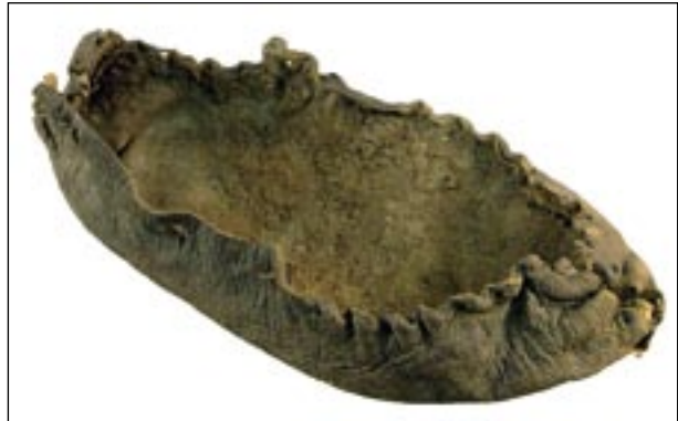
Joonis 5. Ühest nahatükist valmistatud pastel (TMM 21816: NE50044). Pikkus 22,5 cm. Åbo Akademi krundi kaevand, 14. saj. lõpp/15. saj.

Åbo Akademi krundilt leiti rohkesti? Osa esemetest on toodud ehk mujalt Euroopast. Importesemete või sissetoodud näidiste järgi valmistatud esemete rühma kuuluvad näiteks kirjutustahvlite ümbrised (joonis 6).