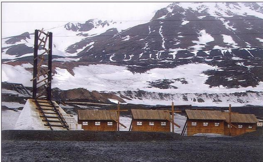
Mälestusmärk hukkunud vangidele koos vaatega Norilski mägedele.