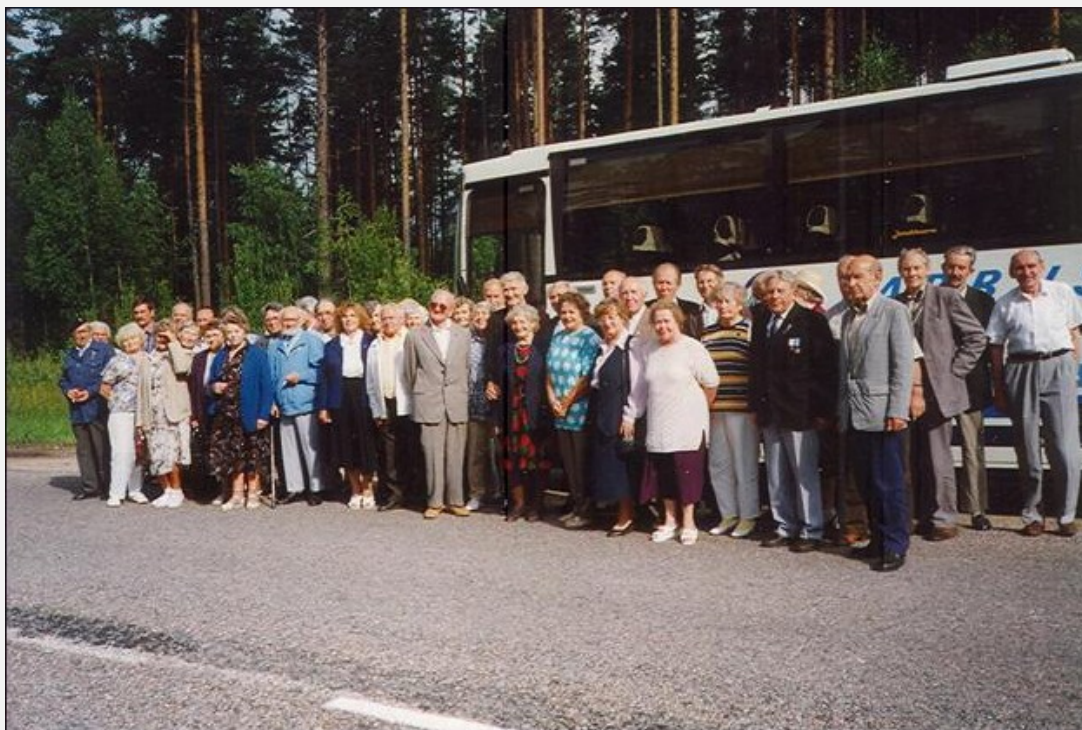
Teel Audru kokkutulekule 1998. aastal

2010. a 1. jaanuari seisuga on Tartu Ühendusel 125 liiget.