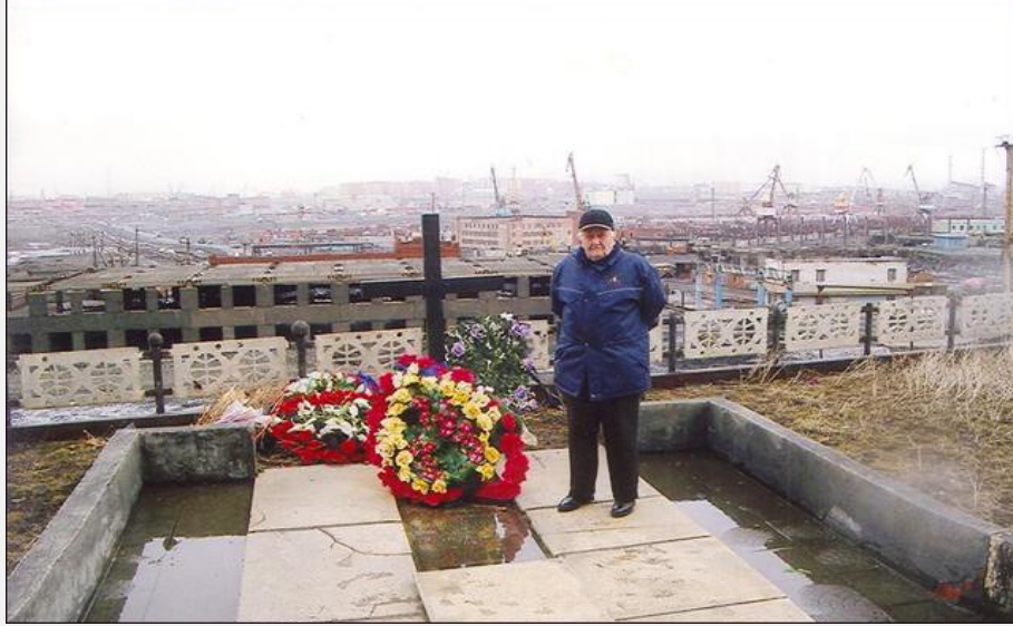
Taustal Norilski linnavaade Smitimäe jalamilt